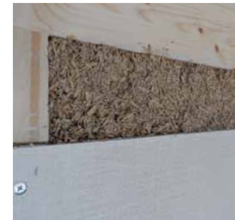
PARETE SANDWICH IN NATURAL BETON®