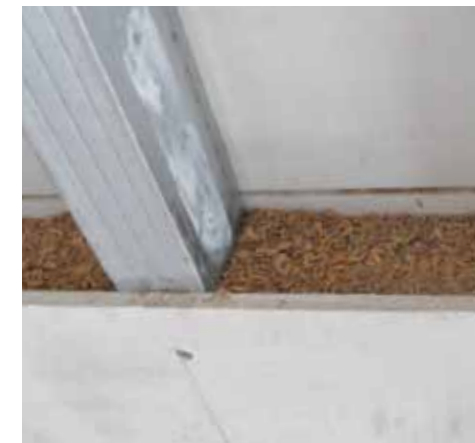
LASTRA DI MAGNESITE