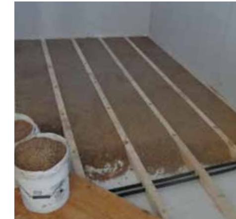
NATURAL BETON® DI CANAPA E CALCE